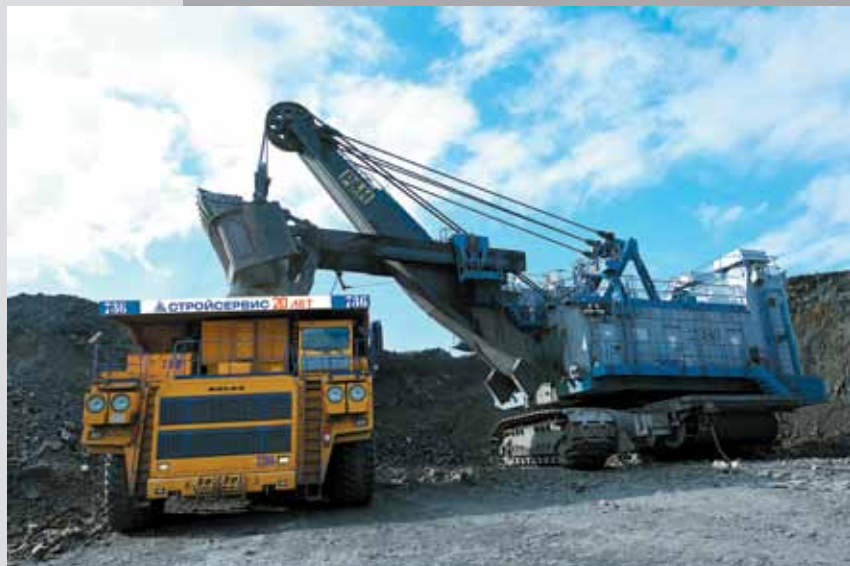
По программе развития на угледобывающие предприятия «Стройсервиса» поступают мощные высокопроизводительные горнотранспортные комплексы. В год 20-летия компании всю технику украсила юбилейная символика