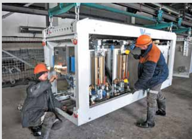
Монтаж оборудования для добычного комплекса шахты «Бутовская»