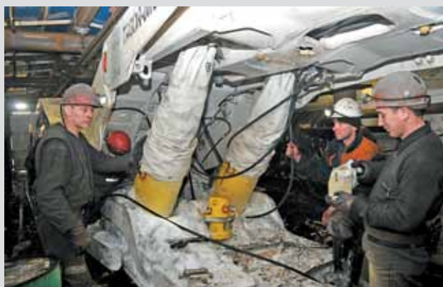
Монтаж гидравлики управления механизированной крепи ТАГОР-0823 на шахте «Бутовская»