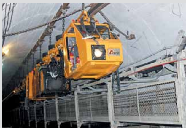
ООО «Кокс-Майнинг» стремится использовать все преимущества современной техники и технологии. Наклонный путевой ствол с дизелевозом шахты «Бутовская»