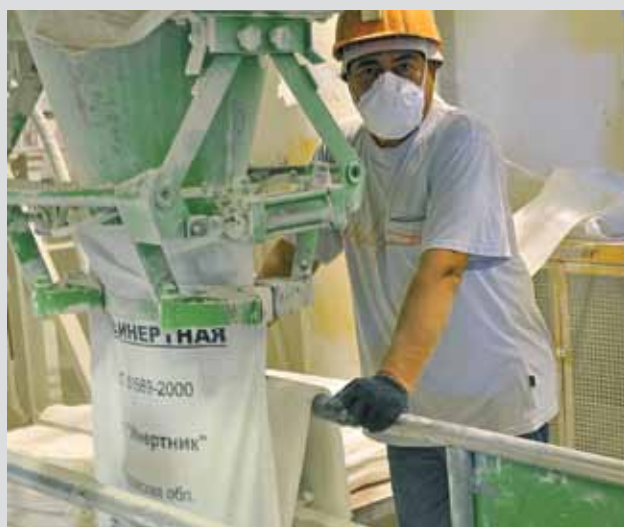
Затарочная линия ООО «Инертник»