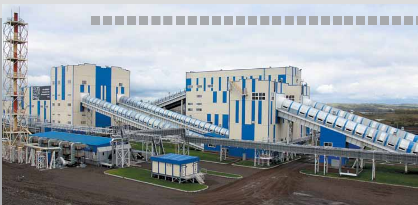
Обогатительная фабрика «Каскад» Кузбасской Топливной Компании, введенная в эксплуатацию в 2013 году