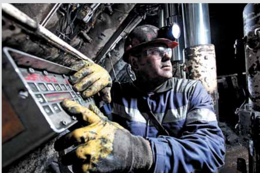
ОАО «СУЭК-Кузбасс» шагает в ногу со временем: управление секциями крепи DBT на шахте «Талдинская» (сверху); диспетчерская шахты имени С.М. Кирова ОАО «СУЭК-Кузбасс», для комплексной автоматизации и обеспечения безопасности горных работ используется система компании Davis Derby (слева); орошение комбайна SL-500 на шахте имени 7 Ноября ОАО (справа)