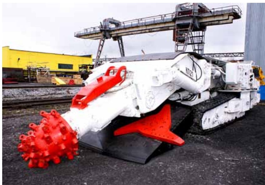
Проходческий комбайн КП-21

УК «Заречная» экспортирует более 90% готового продукта. Среди потребителей — коксохимические, энергетические и другие производства более чем в 12 странах мира, в том числе во Франции, Германии, Испании, Великобритании, Нидерландах и других.