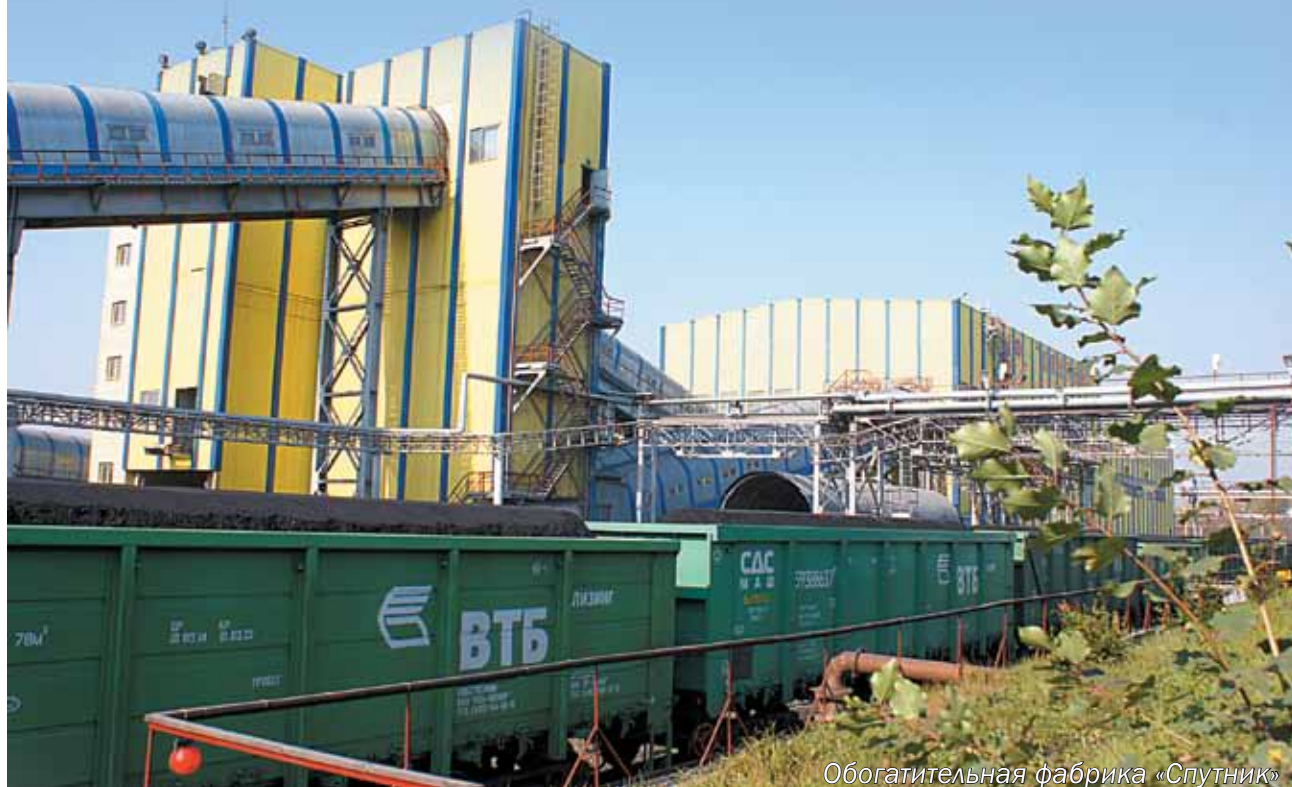
Обогащительная фабрика «Спутник»