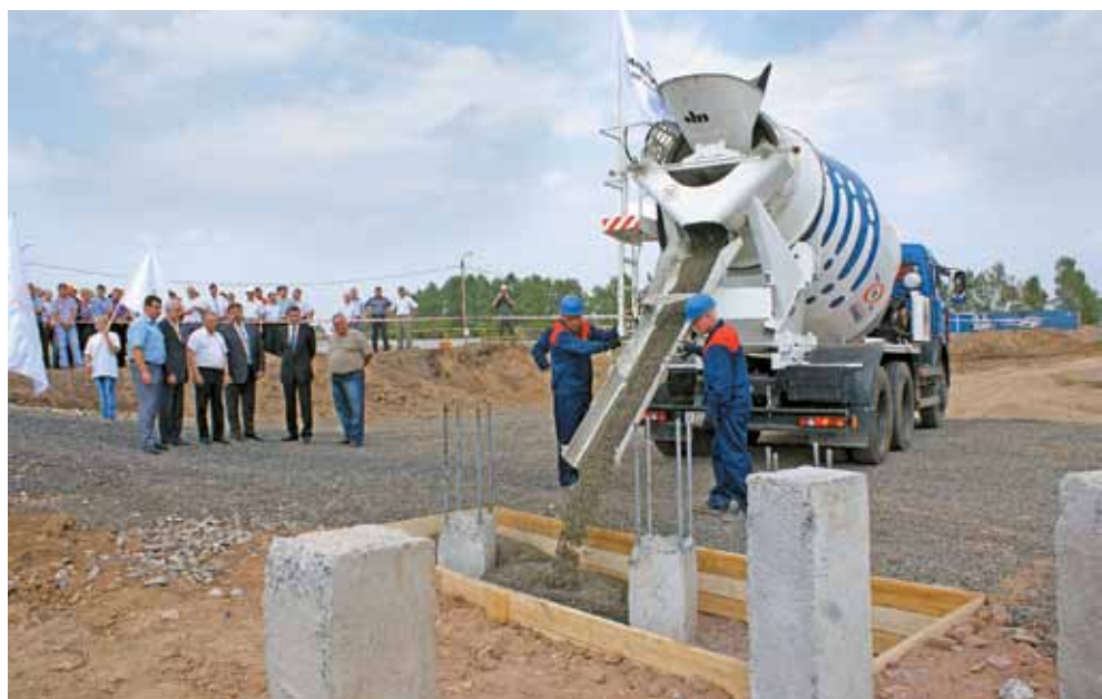
Закладка фундамента на строительстве обогатительной фабрики «Карагайлинская»

Сегодняшняя экономическая ситуация требует от бизнеса принятия стратегических решений, направленных на укрепление своих позиций. Для угольной компании «Заречная» это — диверсификация производства. Специализирующаяся исключительно на добыче энергетического угля, компания приобрела запасы на поле бывшей шахты «Карагайлинская» и начала строительство нового предприятия — ООО «Шахтоуправление «Карагайлинское» по добыче угля марки Ж. Одновременно с шахтой ведется строительство обогатительной фабрики. Расширение марочного состава продукции, обеспечение высокого качества готового продукта поможет холдингу сохранить устойчивость на мировом рынке угля. Запуск объектов намечен на середину 2013 года, юбилейного для Кузбасса и компании. В следующем году Кемеровская область отметит 70-летний юбилей, 5 лет исполнится угольной компании «Заречная», а шахта «Заречная» отпразднует 60-летие. Общая сумма инвестиций в Карагайлинский проект превысит 14