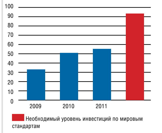
График 2. Объем инвестиций в угольную отрасль Кузбасса (млрд. руб.).

слеживается повышение интереса непосредственно к работникам горной отрасли. Ситуация здесь следующая. Наиболее привлекательным критерием оценки рабочего места для трудящегося остается заработная плата. И с этим в угольной отрасли все в порядке. Средняя заработная плата нарастает уверенно, приближаясь к 40 000 рублей, и на предприятиях, занимающихся добычей полезных ископаемых, задолженностей по выплате денег не имеется.