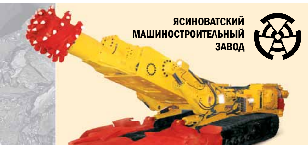
ЯСИНОВАТСКИЙ МАШИНОСТРОИТЕЛЬНЫЙ ЗАВОД

ООО «Ясиноватский машиностроительный завод» является ведущим производителем проходческой техники самого широкого назначения на территории СНГ. Качество производимого оборудования было подтверждено многолетним безаварийным опытом работы на шахтах России и Донбасса.